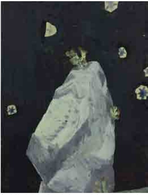
Carole Vanderlinden, 'Le rocher', 2015, technique mixte sur papier, 31,4 x 24,3 cm