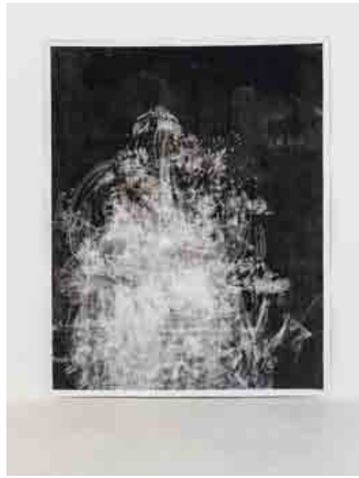
Angel Vergara, 'Acts & Paintings (Untitled III)', 2017, houtskool op doek, 270 x 210 cm