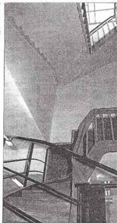
Trophal van het Zwart Huis.